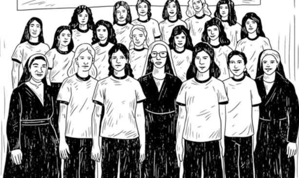
PROMOCIÓN 1972 INMACULADO DE MARÍA

CON LA PLATA QUE NOS CORRESPONDIA COMPRAMOS COSAS QUE PODÍAMOS LLEVAR A QUIENES NOS RECIBIERON EN SUS CASAS, A LAS QUE YA CONSIDERÁBAMOS NUESTRAS FAMILIAS.