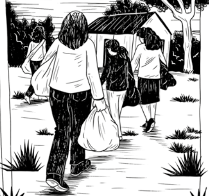
LA EXPERIENCIA ME CAMBIÓ LA VIDA.