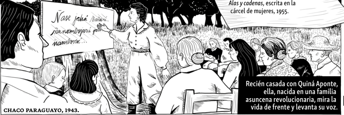
CHACO PARAGUAYO, 1943.

Alas y cadenas, escrita en la cárcel de mujeres, 1955.