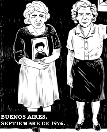
BUENOS AIRES, SEPTIEMBRE DE 1976.