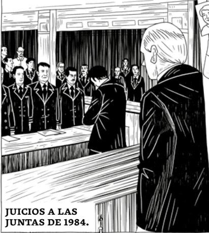
JUICIOS A LAS JUNTAS DE 1984.

Los huesos de esos cuerpos enterrados como NN fueron recuperados en 1984 en el marco de las causas contra la cúpula militar.