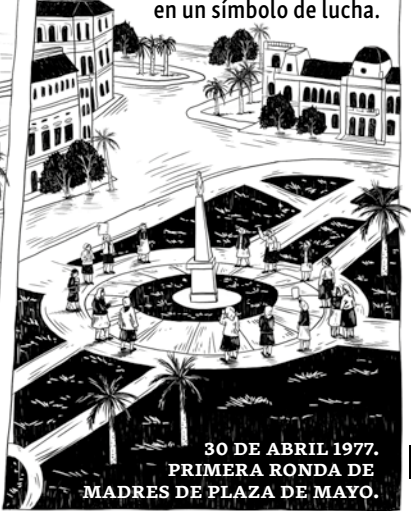
30 DE ABRIL 1977. PRIMERA RONDA DE MADRES DE PLAZA DE MAYO.

Ella y sus compañeras, en medio del dolor, se convirtieron en un símbolo de lucha.