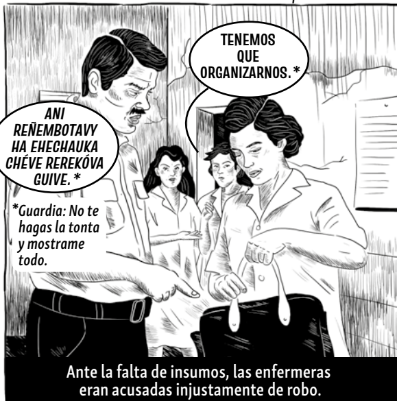
1986. INTERIOR DEL HOSPITAL DE CLÍNICAS.